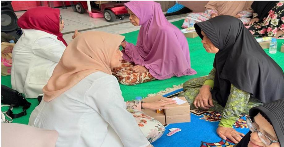
Gambar 3. Konseling Obat