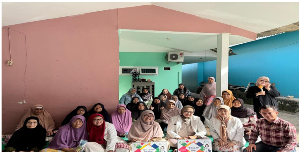
Gambar 4. Foto Bersama Kegiatan Pengabdian Masyarakat oleh STTIF Bogor

Foto bersama selesai kegiatan pada gambar 4 di bawah :